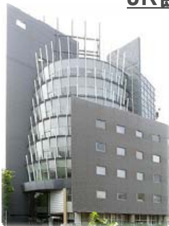
この建物の1階がクリニックです