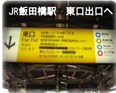
JR飯田橋駅 東口出口へ