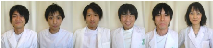
Radiological Technologists and Medical Technologists